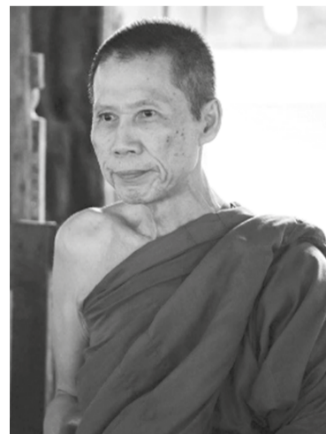
— 阿姜苏查(Ajahn Suchat) —

身体就好像这个亭子，下雨的时候，亭子并不知道下雨。然而亭子里的人，也就是这颗“心”，知道雨在下。心知道关于所有发生在身体上的事，但却没有被那些事影响。就好比坐在亭子里的人不会被雨淋湿，不像亭子上的屋瓦。但是，这屋顶不会感到苦。雨，让它下吧！淋湿也没关系！但是亭子里的人，如果不希望下雨而希望雨停，那就苦。但如果一切顺其自然，雨要下就让它下，因为那是无法控制的。如此，心就不苦。